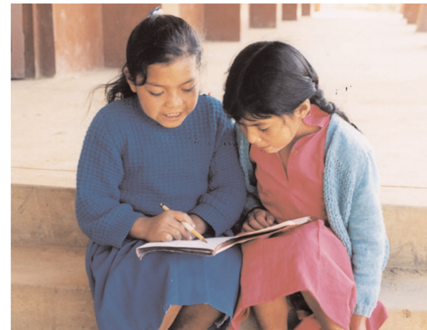
L'istruzione apre le porte a mondi nuovi.

In Perù, la scuola è obbligatoria, ma ufficialmente a dodici anni i bambini possono già lavorare. La frequenza scolastica è gratuita, occorre però pagare una tassa d'iscrizione, il materiale scolastico e l'uniforme. Per la metà dei 26 milioni di peruviani che vive sotto la soglia della povertà, le lezioni scolastiche diventano di conseguenza una sorta di bene di lusso. Spesso anche i bambini che vanno alle elementari sono costretti a lavorare per contribuire al bilancio familiare. Non è dunque difficile im-